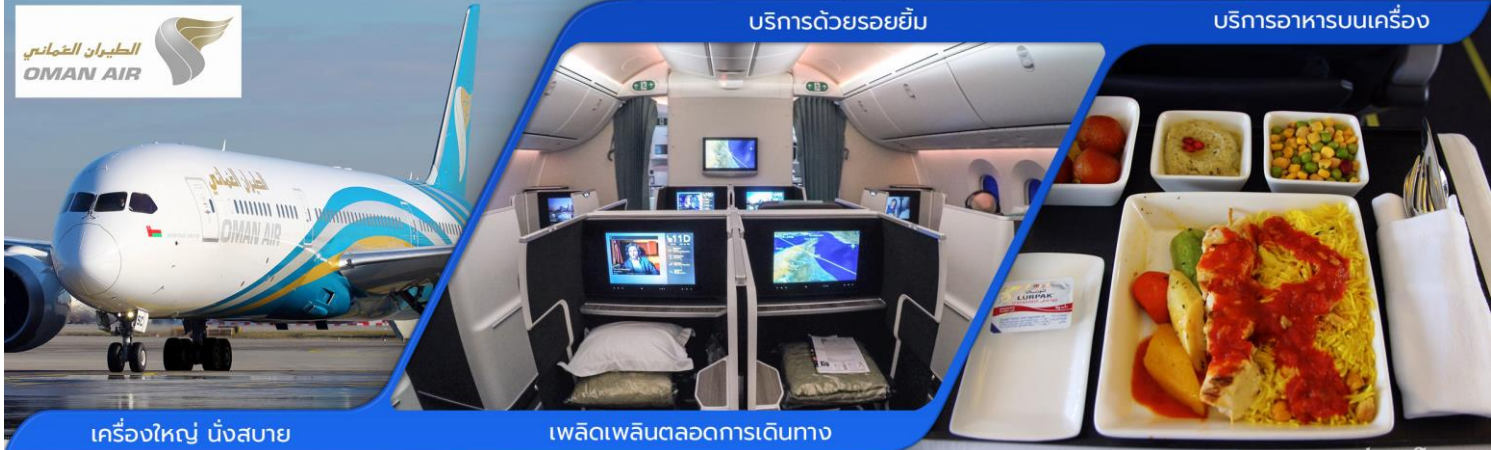
เครื่องบิน บังสบาย

05.30 น. 📢 คณะผู้เดินทางพร้อมกัน ณ สนามบินสุวรรณภูมิอาคารผู้โดยสารขาออกระหว่างประเทศ ชั้น4 สายการบิน OMAN AIR เคาน์เตอร์ T ประตู 8 ซึ่งมีเจ้าหน้าที่ของบริษัทคอยอำนวยความสะดวกเรื่อง